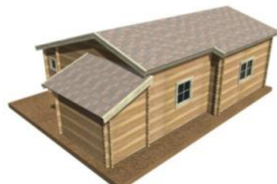
Alexandra II - atyp